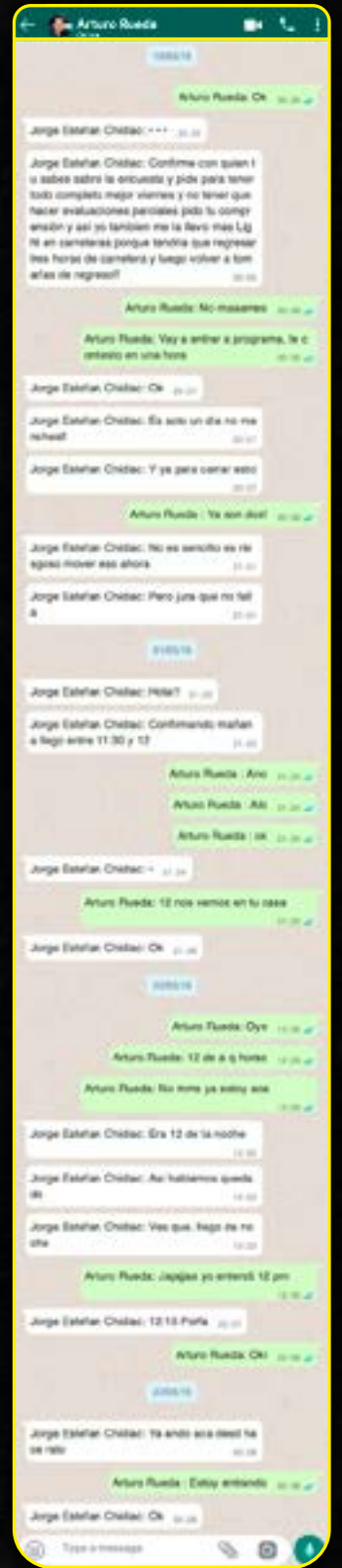
Los chats de Whatsapp muestran la manera en que el director de Diario Cambio solicitaba dinero y presionaba al entonces candidato para que le diera dinero para comprar su silencio.