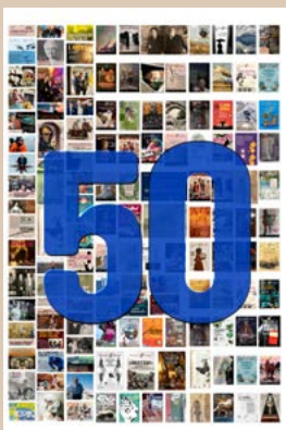
PORTADA Y ARTE GRÁFICO: DE ANA C. LANDA